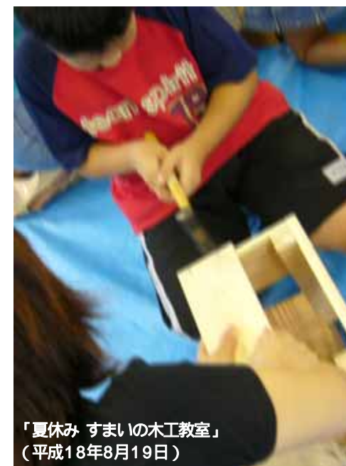
「夏休み すまいの木工教室」 (平成18年8月19日)

神戸市すまいの安心支援センター「すまいるネット」開設から丸6年を経た今般、市民の皆様にとってより一層身近なセンターとなり、また「よりよいすまいづくり」を目指す方々とのネットワークを築いていくため、この度「すまいるネット通信」を発刊することといたしました。取り上げてほしいテーマやご意見など、ぜひお寄せください。「すまいるネット通信」を今後ともどうぞよろしくお願い致します。