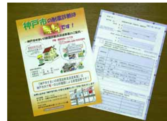
「耐震診断」申込書は、神戸市内各区役所・出張所や「すまいるネット」で配布しています。

また、地震で家具・家電製品が転倒して下敷きになることのないよう、配置を工夫したり、金物等で固定するなど、「すまい方を工夫する」ことによって、地震から命を守ることも大切です。神戸市では家具固定への補助制度も用意していますので、ぜひご活用ください。詳しくは、すまいるネットまでご相談ください。