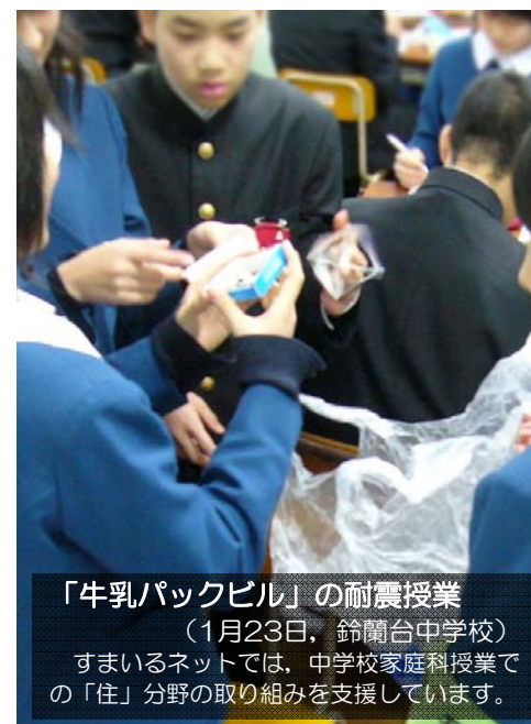
「牛乳パックビル」の耐震授業 (1月23日、鈴蘭台中学校) すまいるネットでは、中学校家庭科授業での「住」分野の取り組みを支援しています。