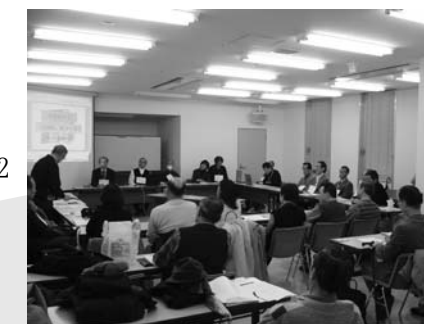
第11回課題別交流サロン（平成19年2月17日） 「マンション管理組合の広報活動」

また、18年度は23組合が新規登録され、登録数は252組合となっています。同ネットワークでは登録組合を募集中です。