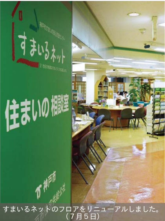
すまいのネットのフロアをリニューアルしました。(7月5日)