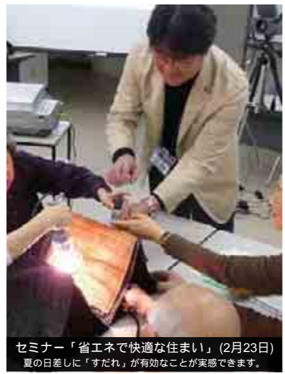
セミナー「省エネで快適な住まい」(2月23日) 夏の日差しに「すだれ」が有効なことが実感できます。