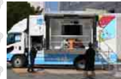
地震体験車「ゆれるん。」

すまいるネットと「住教育支援チーム」は、この数年間実施してきた小中高校での授業の実例をとりまとめた冊子「すまい学習をサポートします～住教育・建築教育の実践集～」を昨年8月に発刊しました。そして、これらの活動が評価され、今年2月には、防災教育に取り組む団体や学校などの活動を評価する「防災教育チャレンジプラン」（内閣府、文部科学省など後援）の優秀賞を「住教育支援チーム」が受賞しました。この受賞で評価されたのは、牛乳パックの輪切り