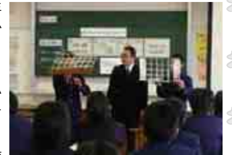
牛乳パックビルを使った授業

すまいるネットでは、市内小中学校の理解と協力のもと、(社)兵庫県建築士会「住教育支援チーム」とともに、「住まい」に関する授業をサポートしています。今の小中学生は、阪神・淡路大震災をほとんど覚えていない、あるいはまだ生まれていなかった世代。そんな彼らに、建築士のゲストティーチャーが、建物の耐震性や安全な暮らし方など、すまいに関する幅広いテーマを、専門家の立場からわかりやすく生徒・児童に紹介しています。模型や映像、発表などを交えた具体的でわかりやすい授業は大変好評を得ています。平成14年頃から取り組んでおり、平成19年度は11校48クラスで実施しました。