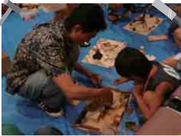
子どもだけでなく、お父さんも夢中ですよ。なにができるかな？