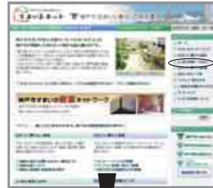
クリックすると Q&A が見られます

ホームページの人気ページである「よくある相談 (Q&A)」には、これまですまいるネットが数多く受けた 102 の相談事例が掲載されていましたが、9 月から相談事例を大幅に増やしました。さらに充実した「よくある相談 (Q&A)」をご覧ください。すまいに関する疑問や悩みの解決につなげてください。今後もさらに項目を増やしていきますので、ご利用ください。