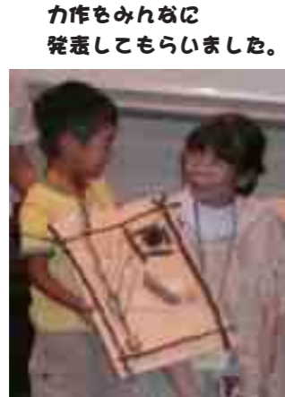
力作もみんなに発表してもらいました。