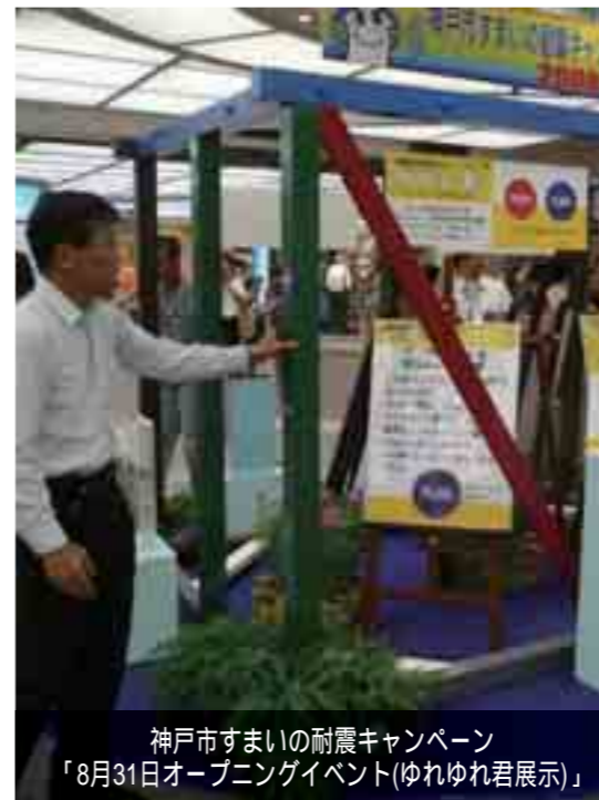
神戸市すまいの耐震キャンペーン 「8月31日オープニングイベント(ゆれゆれ君展示)」