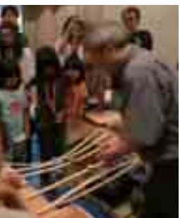
木は弱い？ 強い？ 実験してみよう!!