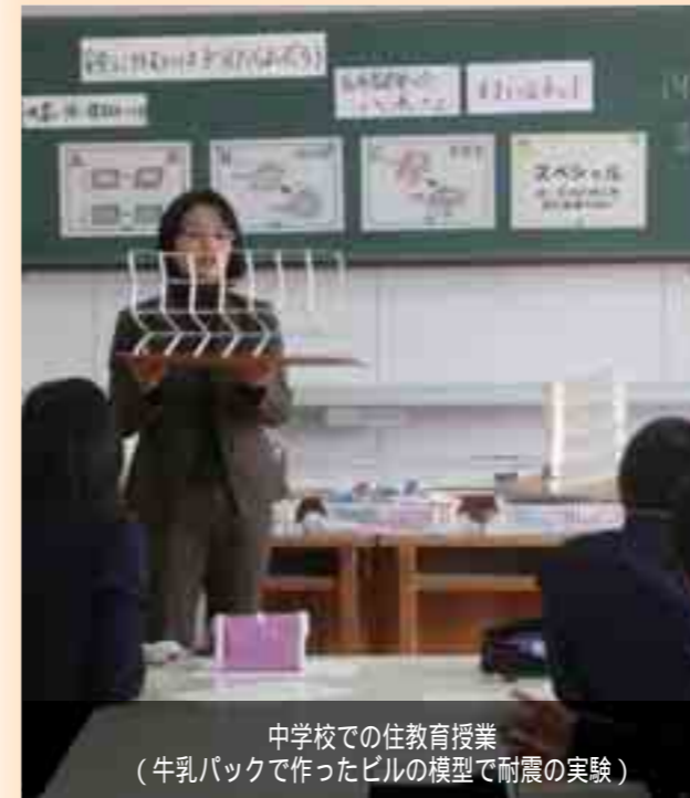
中学校での住教育授業 (牛乳パックで作ったビルの模型で耐震の実験)