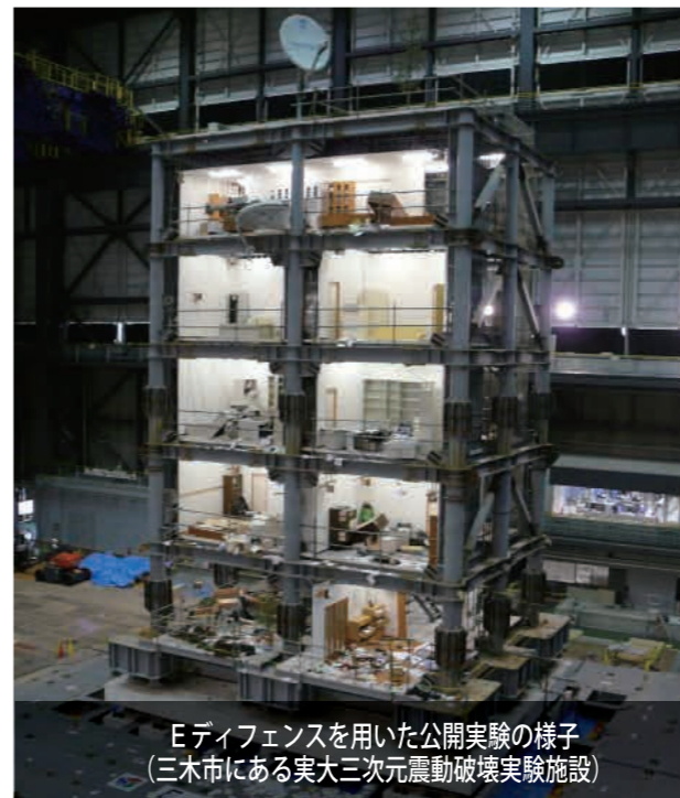
Eディフェンスを用いた公開実験の様子 (三木市にある実大三次元震動破壊実験施設)