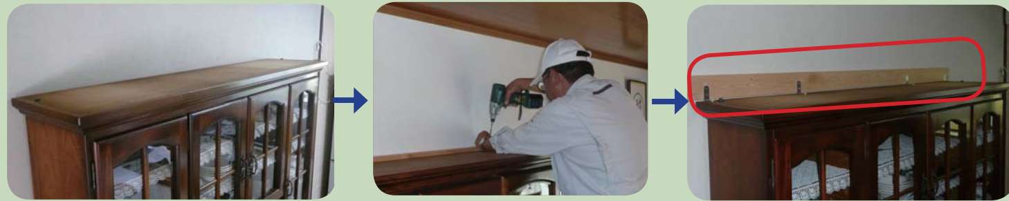
[ 家具の固定後 ]