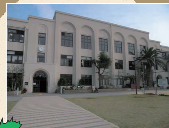
会場となった神戸市立地域人材支援センター