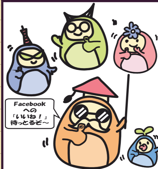
神戸市耐震キャラクター オキールファミリーのfacebook 始めました!!

※セミナーに参加される方は、電話・FAXまたはすまいるネットHPにてお申込みください。タイトル、開催時間、開催場所は変更する可能性がありますので、ご了承ください。