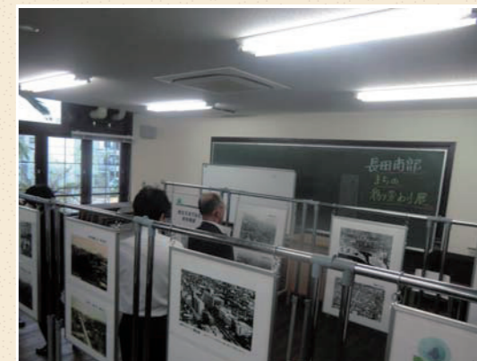
まちの移り変わり展の様子