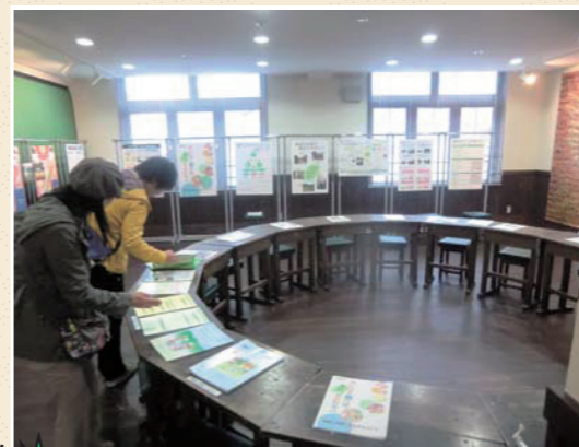
密集事業紹介展示の様子