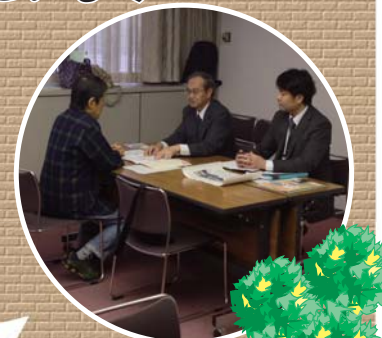
「マイホーム借上げ制度」相談会の様子(垂水区) HLP(ハウジングライフプランナー)の資格を持つ宅地建物取引事業者と神戸市職員が、「マイホーム借上げ制度」の利用を考えている方へ個別相談を行いました。

ご自宅を手放すことなく住み替えをしたいと考えておられる50歳以上の方々を対象として、一般社団法人 移住・住みかえ支援機構(JTI)が運用している「マイホーム借上げ制度」。この制度は、シニア世代の住宅資産を有効活用し、子育て世帯などに相場よりも安い家賃で広い住宅を貸すというものです。昨年の10月・11月に住まいをお持ちの皆様への制度のPRとして、垂水区(垂水区役所)、須磨区(パティオホール)で「マイホーム借上げ制度」相談会を開催しました。当日は多数の方にお越しいただき、「空き家を有効活用したい」「自宅を手放さずに住み替えたい」といったご相談がよせられました。次回の「マイホーム借上げ制度」相談会は、3月に北区で開催の予定です。