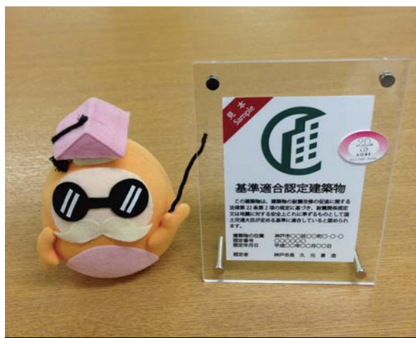
表示マーク（プレート型） ※はかせは付きません。

※この制度は任意です。 建物にこの表示がないからといって、耐震性が確保されていないことにはなりませんのでご注意ください。