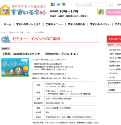
すまいるネットホームページ セミナーの案内