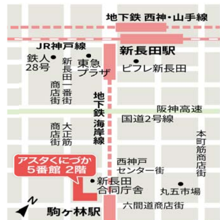
= 会場案内図 =

■ご提供いただいた個人情報は、お申込みのセミナーのご連絡のみに利用し、これらの目的以外に無断で利用することはありません。