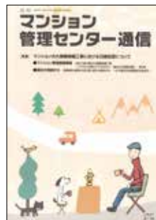
マンション管理センター通信

会員専用サイトの「みらいネットライブラリー」で組合運営に役立つ様式集等を取り出すことができます。