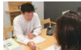
専門家が分かりやすくアドバイス！