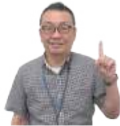
すまいの相談員(建築士)