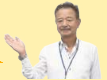
すまいの相談員(建築士)

家はだれも住まなくなると、あっという間に傷みはじめます。大切な思い出のある家が周囲の迷惑になってしまうことも。そうなる前に解体し、菜園や駐車場などに活用したり、土地を賃貸することも選択肢の一つです。