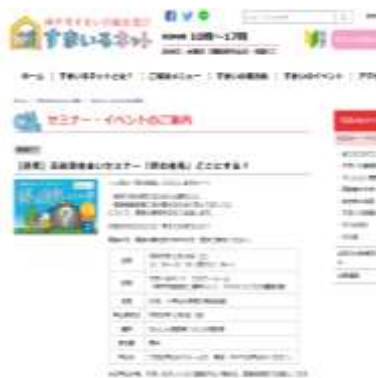
すまいるネットホームページ セミナーの案内