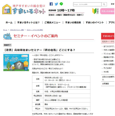
すまいるネットホームページ セミナーの案内